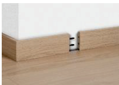
Conexión de 2 rodapiés en una pared